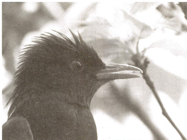
龐克大帥紅嘴黑鴨