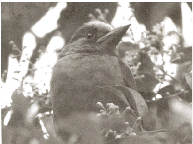
俗稱「花和尚」的「五色鳥」