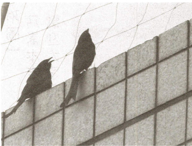
好遠好遠的大樓尚有一對夫唱婦隨的大卷尾

讓一個人汗流夾背在大清早的綠地樹林裡雀躍到不行是因為發現新事物的喜悅。很多人以為為何鳥都不怕我？（不是因為我名字）可以那麼近拍！其實不是的，能夠融入牠們的世界，定下心排除雜訊，專注聲音來源，眼看是否有枝頭晃動，初步確認再以類單拉鏡頭，鎖住焦，克服近視加老花，主角才會是每一張張的畫面！