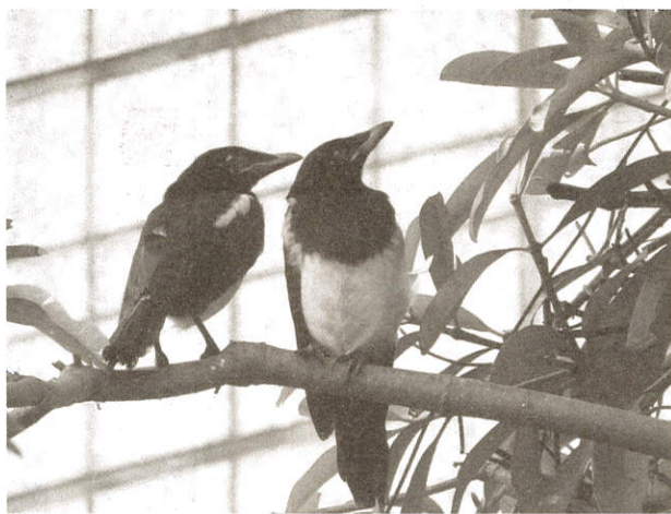
喜鵲成雙！儘管他看來沒有很喜氣！