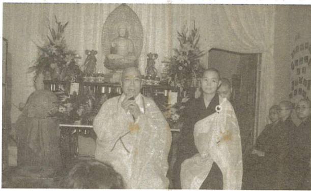
普行精舍佛像開光禮請上真下華長老開示