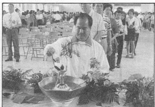
7. 大甲鎮長希望浴佛使人人找到「自心」。