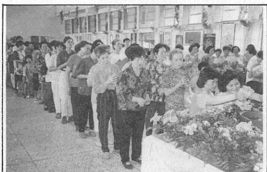
9. 信眾歡喜等待此刻的來臨。