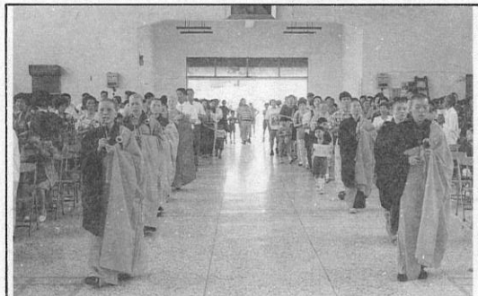
5. 法師引領大眾浴佛。