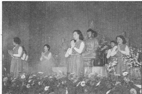
4. 曼妙舞姿、讚頌佛陀的偉大。