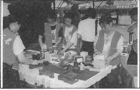
15. 佛教文物盡是琳琅滿目。