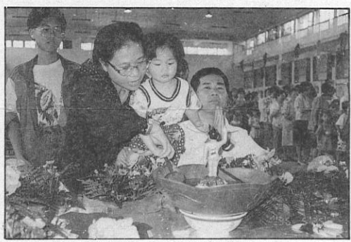
10. 寶寶也來浴佛、祈求智慧增長。