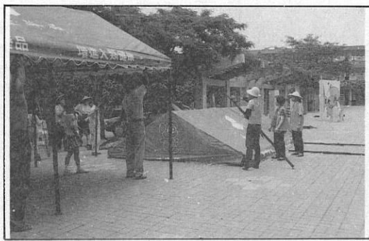
2. 搭帳篷自己動手，義工隊熱心參與。