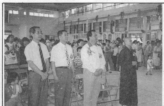
8. 感謝各級長官蒞臨會場。