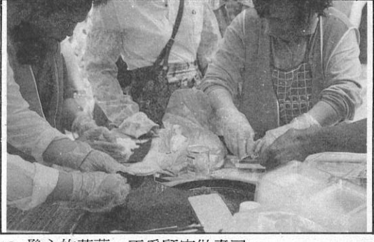
18. 發心的菩薩，正為顧客做壽司。