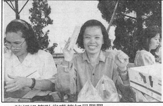
17. 陳師姐算點卷嘴笑加里腮腮。