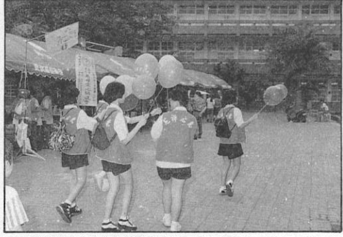
13. 啥款！這個智慧球「有水帽」！來一個吧！