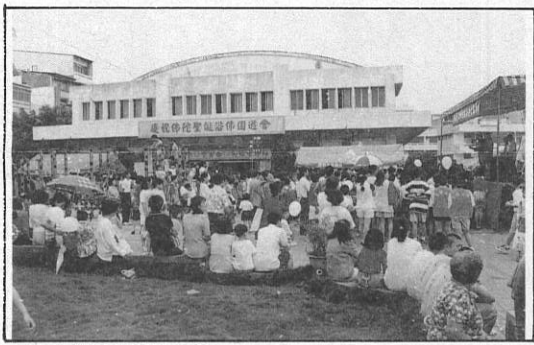
12. 會場裡裡外外盡是人潮。