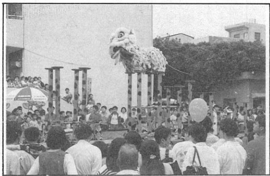
3. 祥獅拜佛、拉開法會序幕。