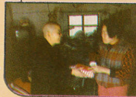
猶需之困臨 炭送中雪如