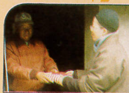
冬的冷寒最在 暖溫遞親天