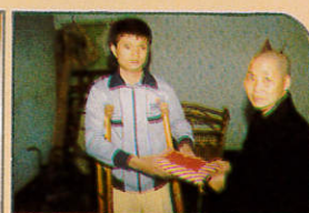
民入深長社 心愛送傳宅