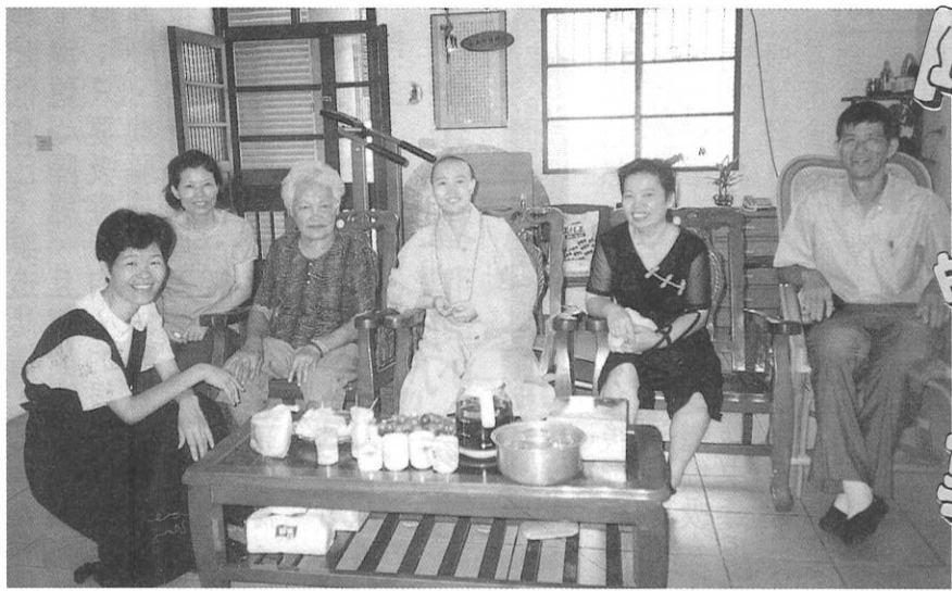
法師與阿嬤喜悅地合影

那天我們幾位義工和師父去訪視參加長者學園的老菩薩。阿嬤聽到師父要來訪很高興。早就在門口熱切地等候的他，一見到我們就熱情地擁抱、話家常，仔細一看！阿嬤已是髮白、背彎，齒搖，眼花，又重聽的人了，與她講話還得像吹「薩克斯風」一樣要使盡奶力，他才聽得見，但是她的精神非常好。