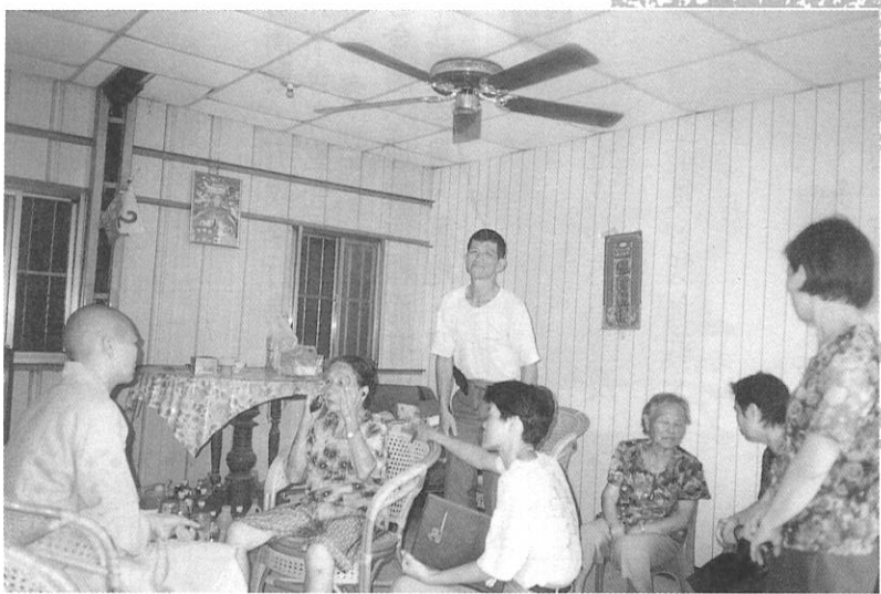
印持師父率領幾位義工菩薩關懷長者居家生活