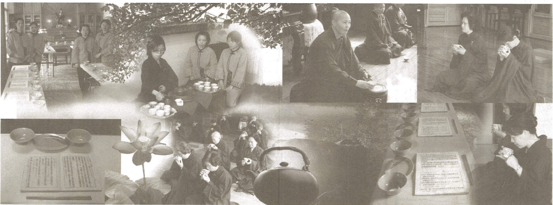
行、住、坐、臥皆是禪，只緣當下即是。