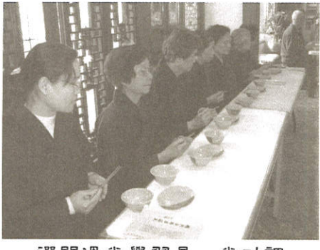
禪門過堂學習是一堂功課