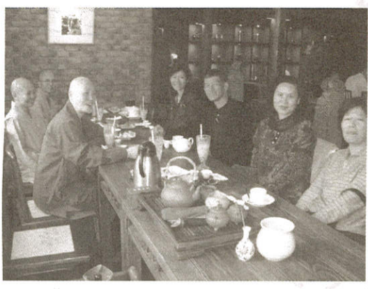
喜閱讀書會春水堂新春茶會