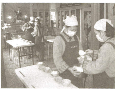
行堂服務謹慎培福之基