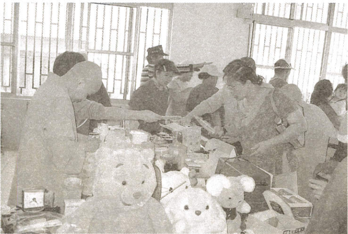
《山居居民消費的很開心》跳蚤市場→每樣10元