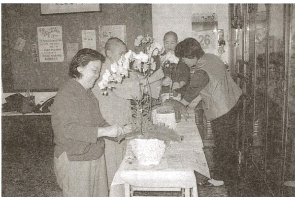
《蘭花！高貴不貴的組合植栽》 供佛、饋贈親友兩相宜