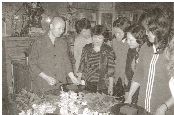
《西洋花藝插花式圓型示範》