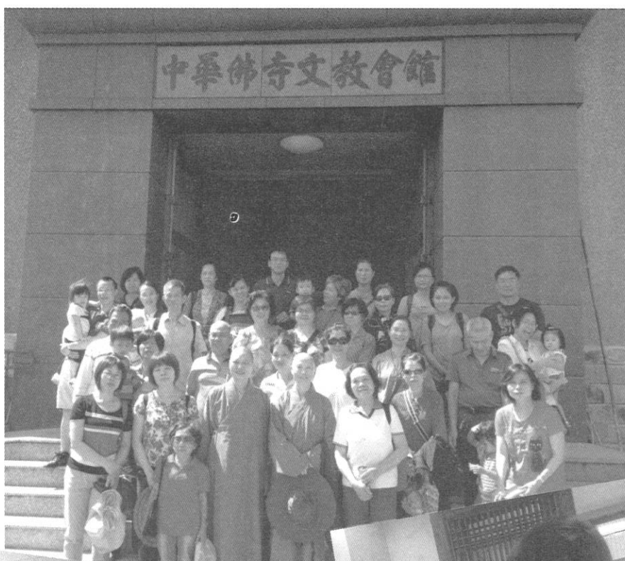
參觀佛寺協會受到熱情款待