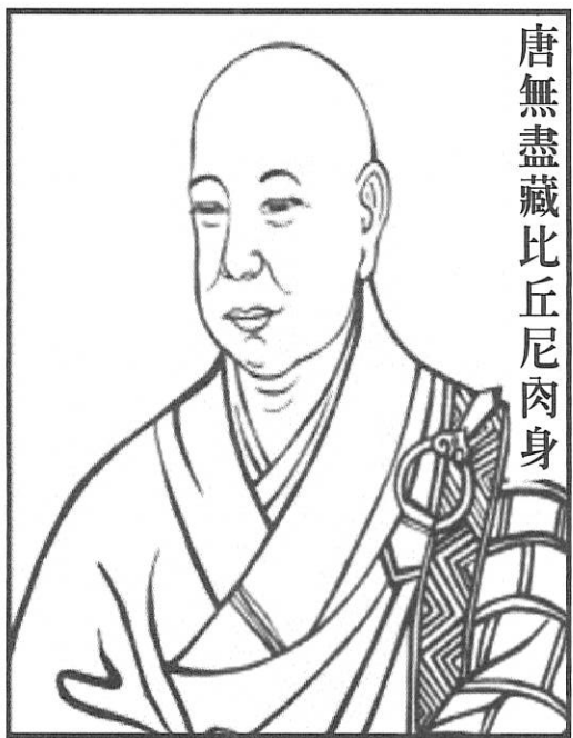
唐無盡藏比丘尼肉身

無盡藏比丘尼聽了非常驚訝，就到處去轉告里中的耆宿大德說：「這是一位有道的人，應當請來供養。」於是有魏武帝曹操的遠孫曹叔良以及當地居民，都爭相前來瞻仰禮拜六祖大師。