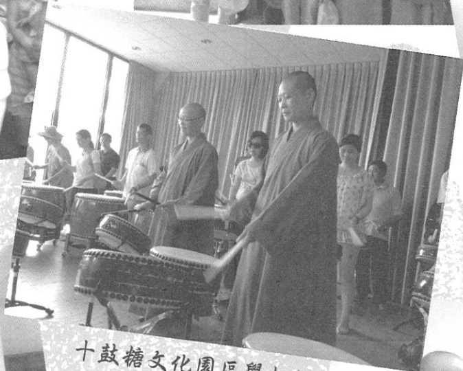
十鼓糖文化園區學打鼓