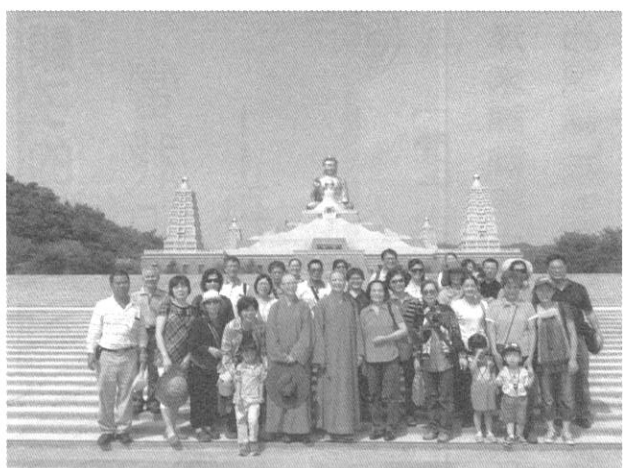
佛館大覺塔前合照