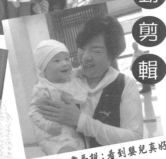
秘書長說：看到嬰兒真好