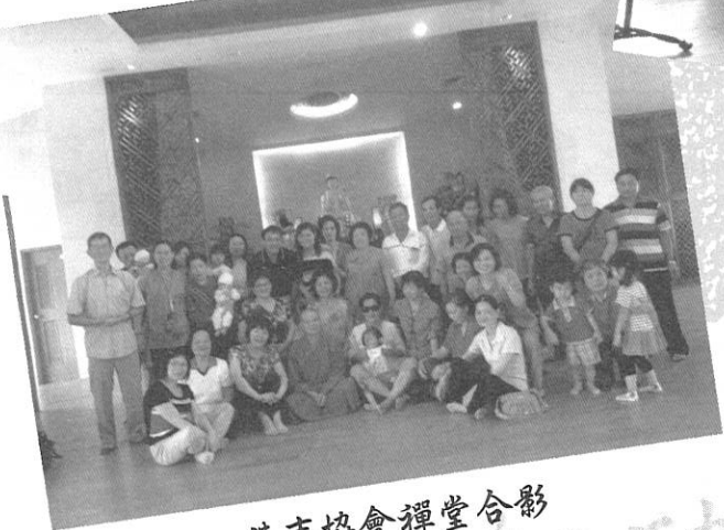
佛寺協會禪堂合影