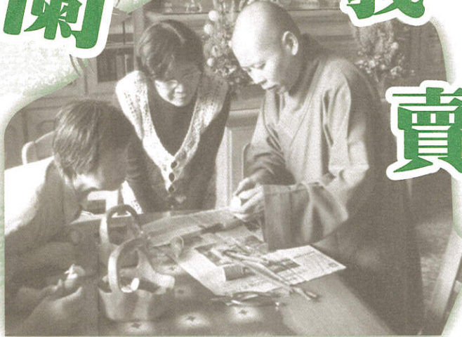
親自DIY做小飾品粧點蘭花