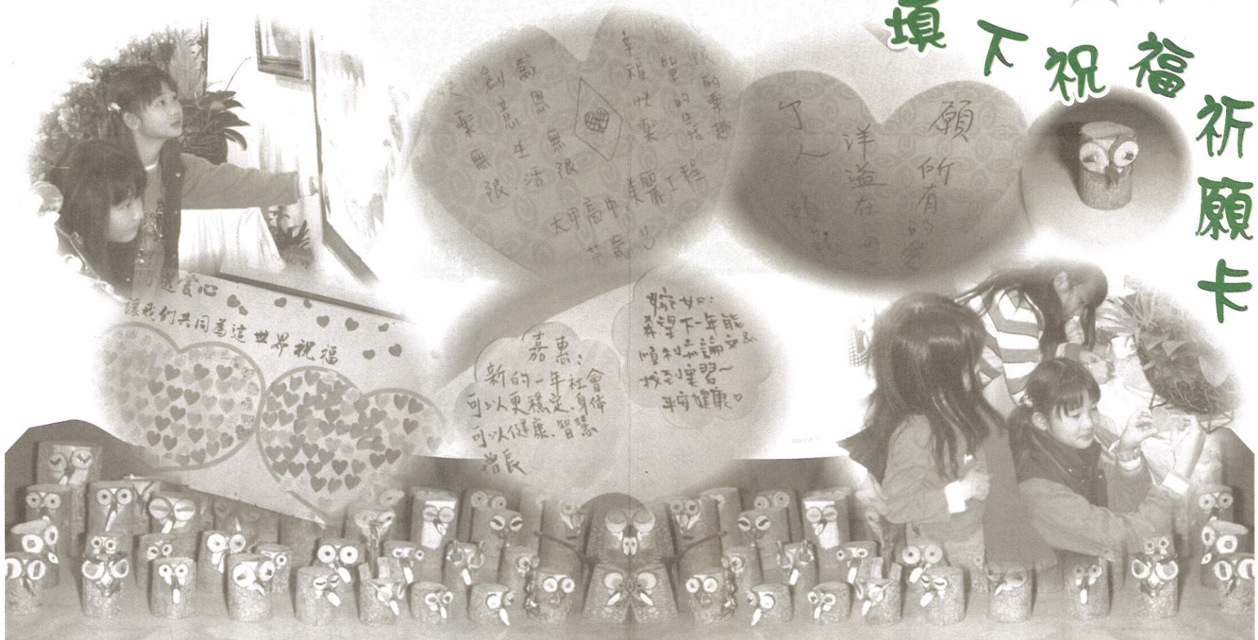
點點滴滴的辛勞！幸幸福福的回饋！心充實了！再也不怕外面驚濤駭浪！