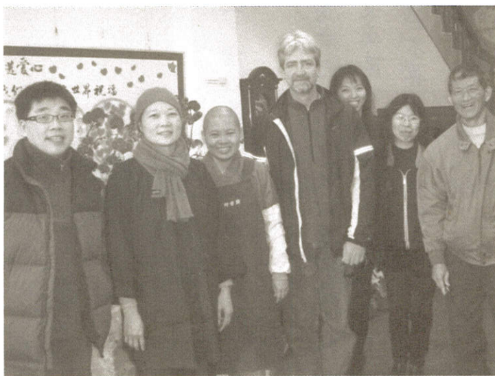
三民店與馬哥的合照

在經濟飄搖的二〇〇八歲末，我們還是衝向蘭花植栽義賣第八年。記者問：「經濟不景氣對這次義賣有影響嗎？」我很想說：「沒影響！」因為我自信滿滿！喜悦洋溢，不覺辛勞，因為愛花之人是慈善之人，給予我們的回饋超越經濟上的價值，更何況買氣很旺！志工不畏辛苦，歡喜忙碌！買花朋友填下的祈願卡裏有位小朋友寫著：「我T-X 這家店了L-P-X 了！」是啊！我們大家「P-X」了很多身、心靈上感恩的「<P>」！施福的「<P>」！正向良善的「<P>」。