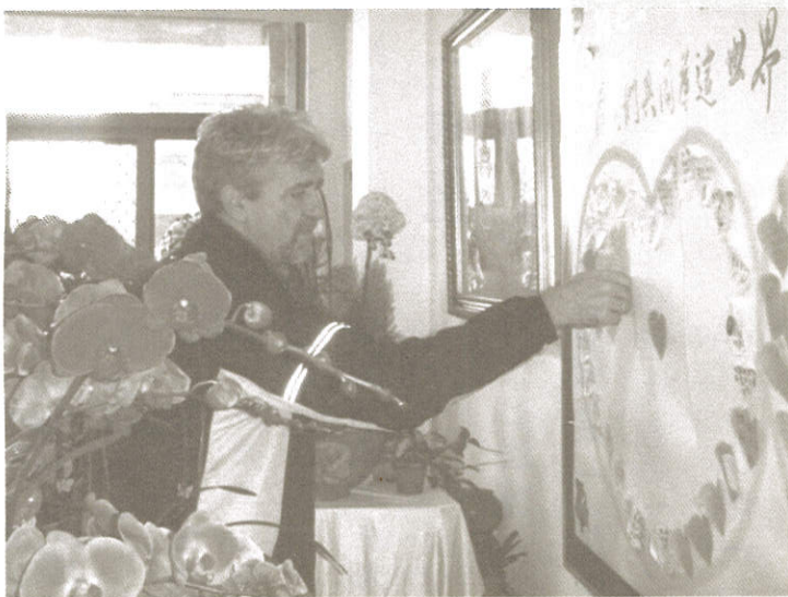
馬哥也為大家祈福