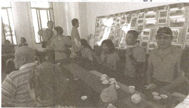
紳士協會自由車隊來品茗