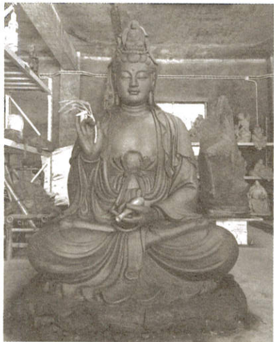
觀世音菩薩像總高8尺1吋(台尺)

依託，一尊莊嚴的佛像所產生的無量功德，豈是我人用金錢所能校量的。今值造像因緣能隨喜捐助者可真是百千萬人中的大福報。