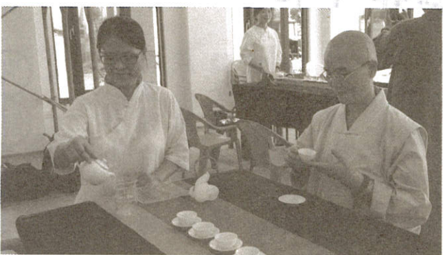
品茗是有苦澀有清香還是...