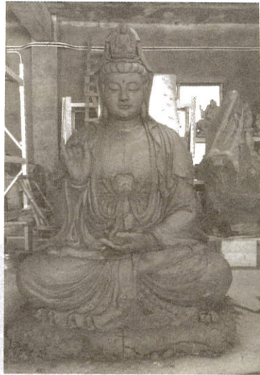
第一階段泥朔粗胚