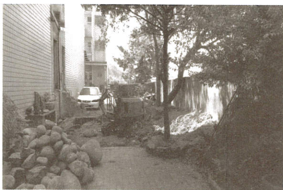
大寮再擴大一點吧！