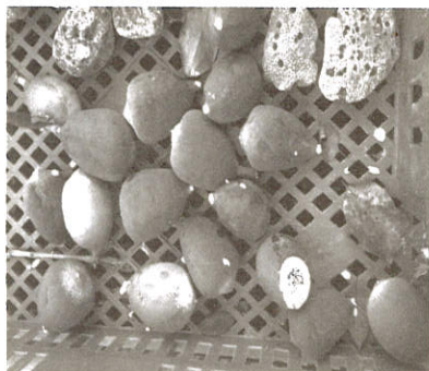
為了擴建廚房捨不得砍了樹 赫然發現他（愛玉）