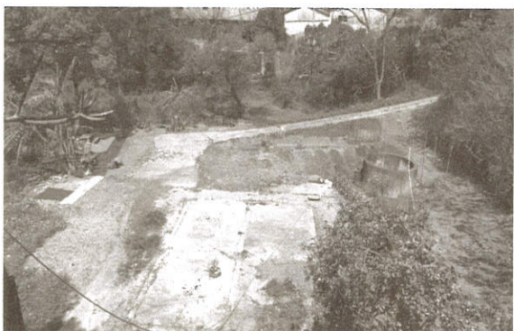
還沒辦法興建先種菜囉