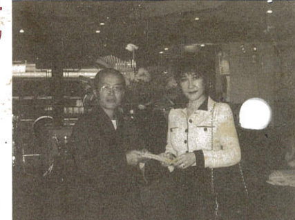
老牌明星丁佩小姐拋磚引玉捐助玉佛