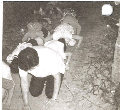
健康身心歡喜滿山朝山信徒

天下那有不散筵席呢？在活動落幕之後，收拾整理善後工作。由於人多，「義工」隊人員缺乏，難免在服務上會有所疏失，若有服務不週，或造成不便之處，在此藉著雜誌出刊的一角，轉達這份歉意。回家的途中，大家心中充滿喜悅。這一場活動又豈只是難得的清涼？所到之處盡是歡喜，感動不已的人想必不少。生命行囊裡恐又多了彌足珍貴的回憶，然而之後呢？船過水無痕？或會有些微然的改變？「如人飲水，冷暖自知」，點滴在心田，當您再度面臨一幅幅虔誠喜悅的臉孔，相信除了感動更會有積極的行動，此即所謂入寶山不空回。