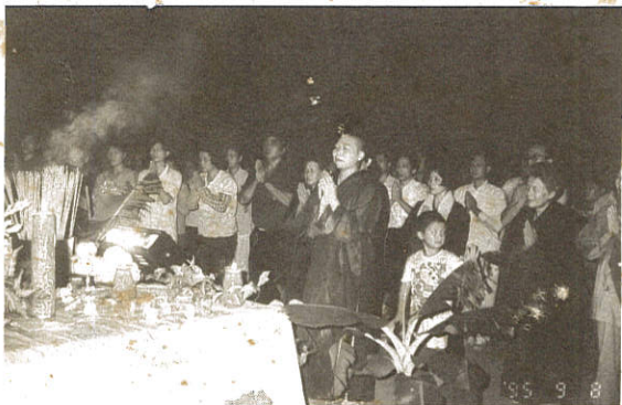
農曆8月14日夜后里息心禪苑道場莊嚴