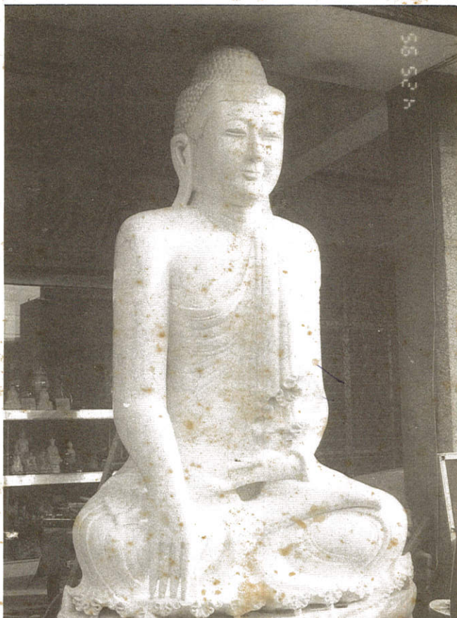
玉佛身上血管絲絲清晰，感應香江名影星