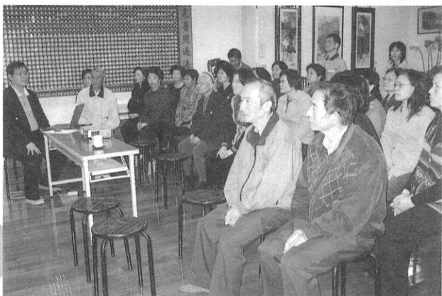
(健康很重要，大家都凝神靜聽！)

病，由第四位死亡率跳到了第一位，而素食正是對付這種問題的主要武器。不食肉這個問題大家以為很難，認為營養會不夠，其實很容易辦到，只要把穀類及堅果類配合起來，便能製成味道很好吃又營養的素菜。談到家禽也是非常可怕，口蹄疫死了很多豬，禽流感也死了很多雞，這些病毒最後都會感染給人類，最明顯的就是現在SARS疫情，流感疫情，不也是死了很多人。素食絕對不含膽固醇與飽和脂肪，再加上正常起居，多運動，你就是最健康的人了，而且身上的器官不必再為那些難消化的肉，肥肉而疲於工作，心臟血管病又與你何干？所以勸你不要為了三吋口舌，短短距離的味覺而傷了身體，使病痛纏身，太不幸了！