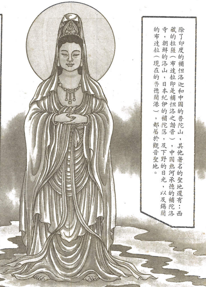
除了印度的補陀洛迦和中國的普陀山，其他著名的聖地還有：西藏的拉薩（布達拉即是補陀洛之諧音），中國熱河承德補陀洛寺，朝鮮的洛山，日本紀伊的補陀落，及下野的日光，以及錫蘭的布達拉（現在的普德蘭港），都屬於觀音聖地。

宋以後的儒家——理學家們，由於大程夫子——程顥（明道），變更佛、道兩家修煉靜坐的心法，因襲禪宗大師修習禪定的工夫，著作「定性書」一文，主張在「靜」中涵養性理的端倪開始。他的老弟二程夫子——程頤（伊川），又加上「主敬」為其陪襯，從此儒門也主張靜坐。但是他們所取的靜坐姿勢，便是平常的正襟危坐，所謂端容正坐便是。至於道家，有時即用佛家的七支坐法與臥姿，有時又穿插許多不同的形態，配合生理的需要與煉氣修脈的作用。大體說來，儒、佛、道三家的靜坐姿勢，並不外於此法。