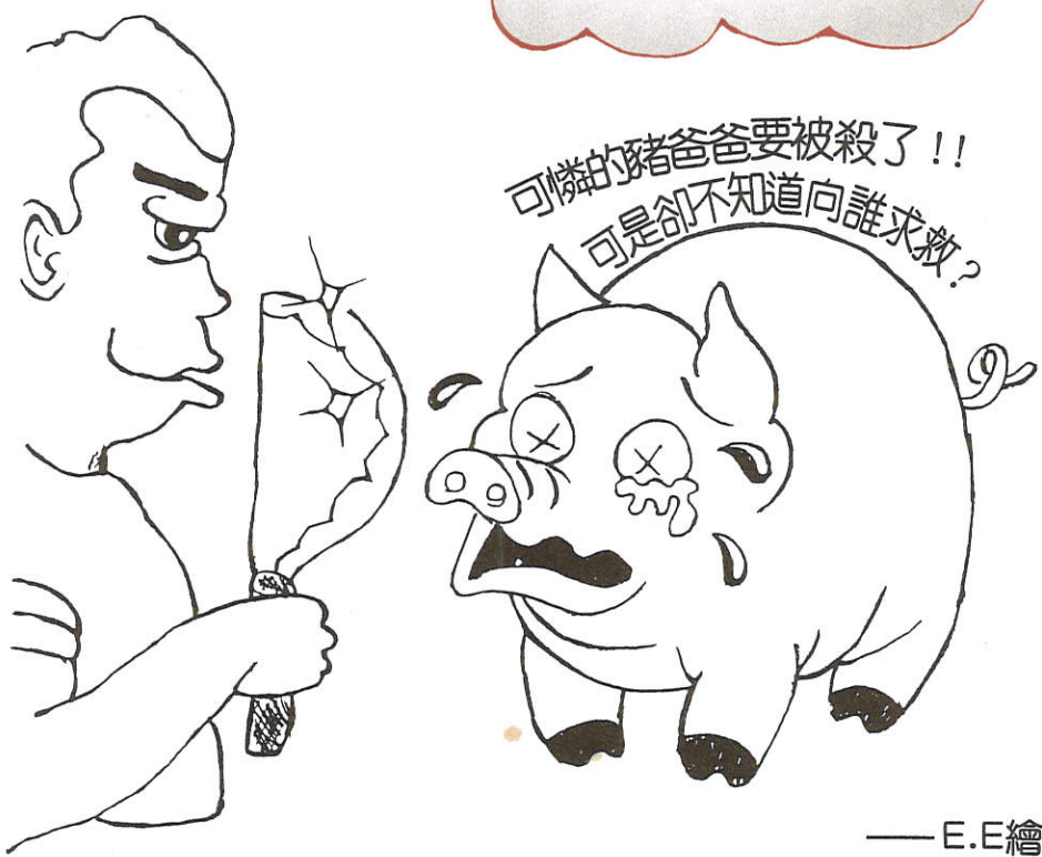
— E.E 繪