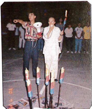
△營主任舉起火炬破除黑暗。