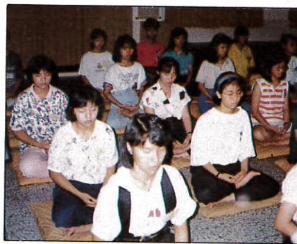
△禪的訓練：入定三昧。