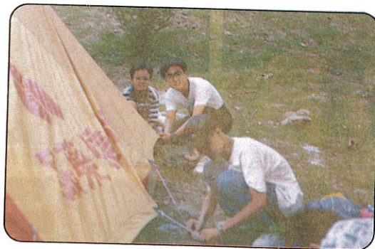
△紮營本領，我們最行。