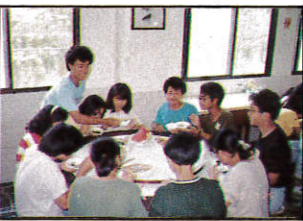
△愛就是把菜夾給她。