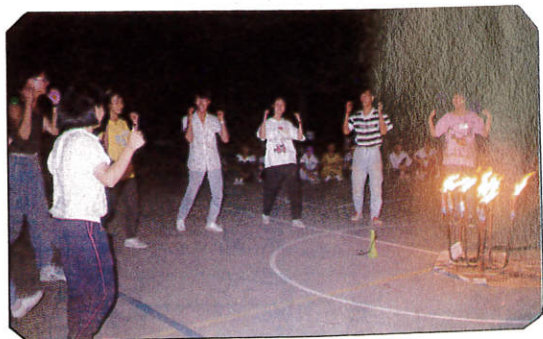
△營火晚會，載歌載舞。