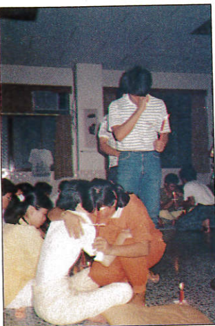
△肩並肩，你我共一心。

小隊長，可是有一點實在令人忍不住要對他生氣，為什麼他老是亂湊我的名字呢？我對他印象真的很深，不但會表演，而且也很會煮飯炒菜，色香味俱全。在這幾天中的相處，我真的很喜歡第6小隊，真的好喜歡隊上每一個人，看他們表演時認真的投入，互相的關心、照顧，很捨不得離開他們，希望他們能和我時常保持聯絡，不要寫了，再寫就要哭了。