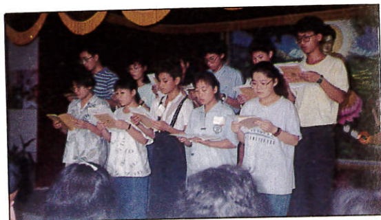
△佛曲比賽，梵音嘹亮。