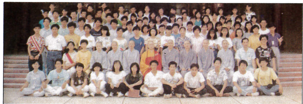
台中縣大甲鎮妙法寺高中佛學夏令營留念 79.7.28.