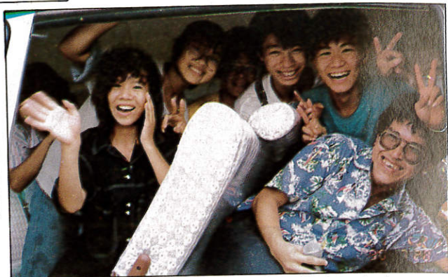
△擋不住的感覺，就是擠成一堆的汗臭味。