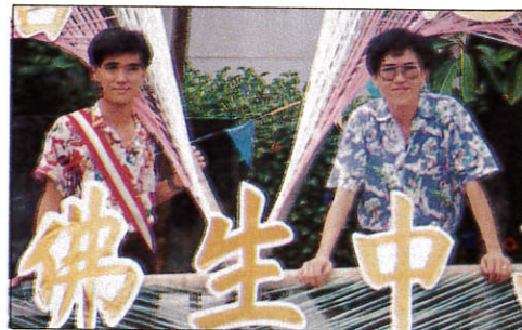
△最佳搭擋！ 蔡老師與值星官。