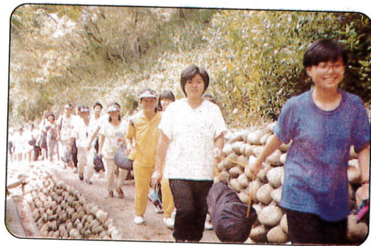
△輕鬆一下，樂在郊外。