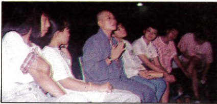
△心靈夜話傾聽師父的心願。