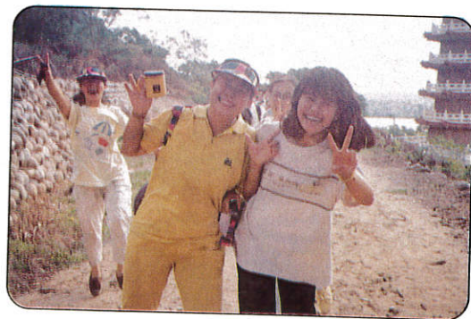
△輕鬆一下，樂在郊外。