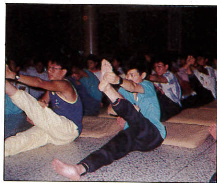
△禪的訓練：坐久了舒展筋骨。