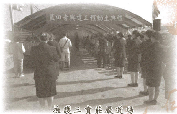
擁護三寶莊嚴道場