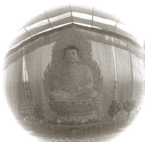
佛眼廣無邊會場現莊嚴

新春團拜共修：國曆二月二日起每週日晚上七點卅分 觀音菩薩聖誕大悲法會：國曆三月十六日早上八點卅分 盂蘭盆報恩法會：國曆七月廿八日至八月三日 藥師如來點燈法會：國曆十月十七日至十月十九日 梵音嘹唳一日佛：國曆一百零四年一月七日 佛陀成道暨謝安法會：國曆一百零四年一月廿五日 藍田寺金剛經共修 每月第四週星期日上午九點