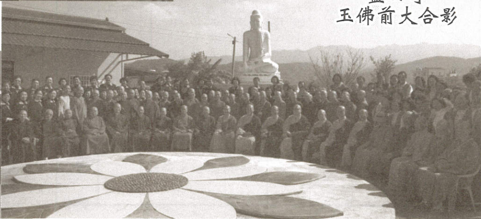
藍田寺玉佛前大合影