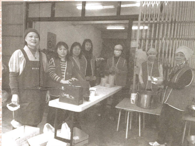
天冷甜食暖心房。佛陀成道臘八粥沾光