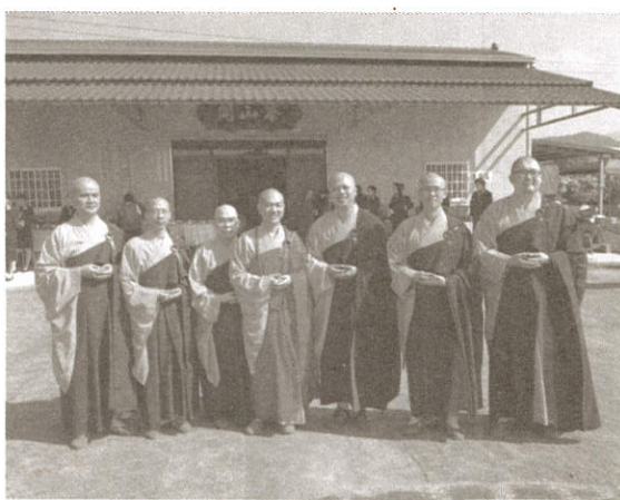
傳妙法師與悅眾法師