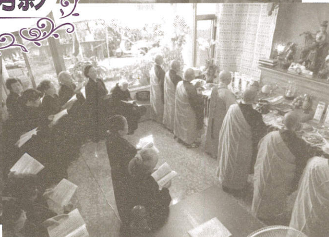
獻供的小孩通通有獎.....