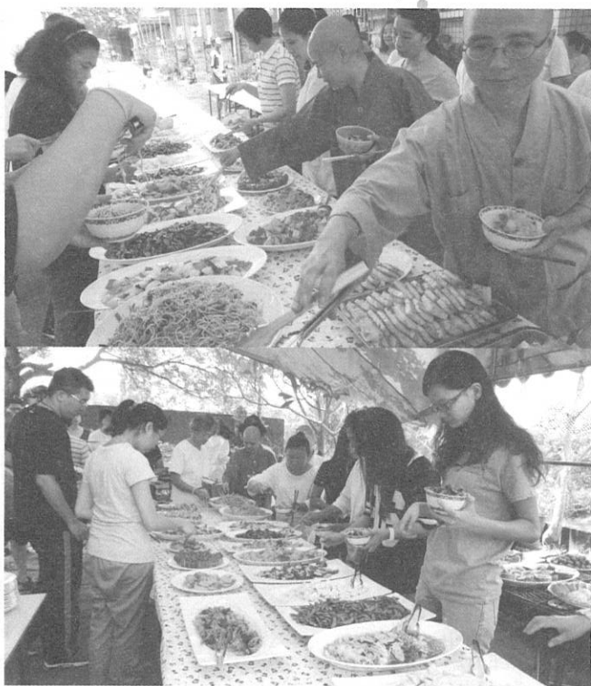
歡喜服務也很精進