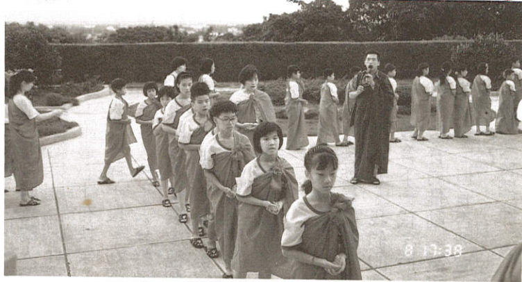
△念佛、繞佛、莊嚴威儀