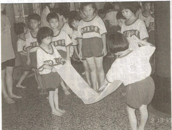
△抓住要領，折疊法衣

瞧這些小不點，小可愛，靜坐可是有模有樣，動也不動；托起鉢來，可是個個精神抖擻，活像個小菩薩。也不知這小學員們前世修了多少福，植了多少善根，小小年紀，就體驗這些僧家生活。如今，學佛營結束了，我希望他們善根早日萌芽，個個早日成佛。