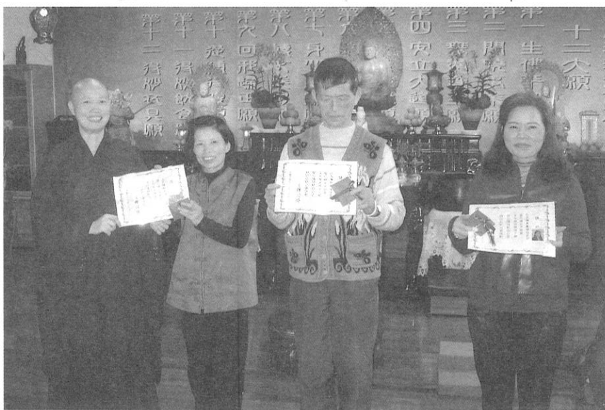
▲九十三年度，大願共修會裏的不缺席精進菩薩……。 ~應當為他們鼓掌~

霖緣花藝 尋尋覓覓 何需遠求 花俏莊嚴 盡在霖緣 文一文教基金會附設霖緣花藝 走廊。舉凡開幕誌慶、佛前供花、 節慶花籃，歡迎訂購，竭誠服務。 TEL：(〇四)二六八八一〇六〇 聯絡人：永蓮