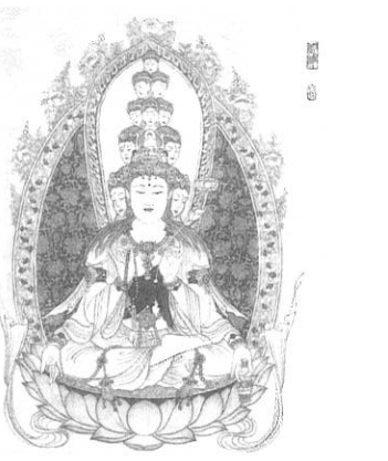
▲十一面觀世音菩薩像 朱砂工筆 絹本

非在我們常人的認知範圍之內。佛教中，每位大菩薩的形像，都象徵著某種深刻的意義。觀世音菩薩千手千眼的造型又代表什麼呢？千隻眼睛代表透澈一切萬法的智慧。人如沒有眼睛，見不到光明，什麼都不能看，難以辨識事物，安頓生活，那很痛苦，很不幸的。而一千隻手，則代表種種濟生利眾的方便，也是智慧的一種行為表現。所謂方便，並不是隨隨便便、馬馬虎虎，人家的東西我也可以隨手拿來使用，不必去買，那很方便。如果當做這樣解，那就不夠水準，太不懂事了。