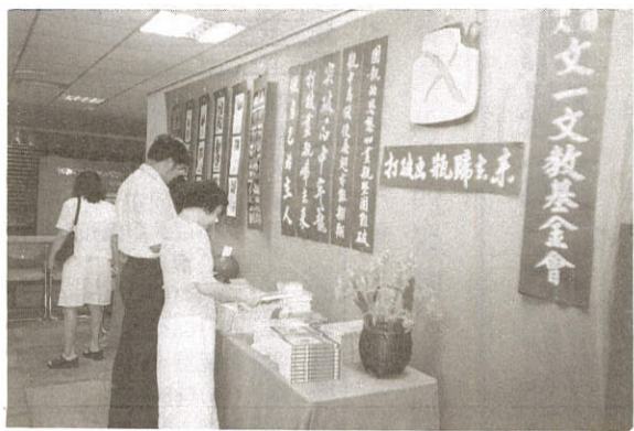
· 舉辦各種教育文化及有關公益活動是文一的宗旨目標