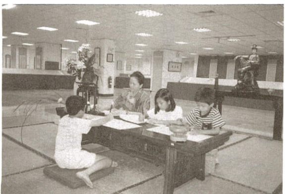
· 瞧！小朋友們忍不住也在紙上揮筆起來

學研習、義工訓練、雜誌出刊、送書給受刑人、社會救助。風雲變色的九二一——息災點燈為民眾帶來團結溫馨，敬老賑災愛心園遊會，更是震災後的第一道陽光，看完了回顧展之後，更被「師父」的悲願所懾服，用心良苦策劃出各種課程，這也是文一文精神的文教特色之一，我何其有幸參與各項義工及共修活動，雖然發現每一個因緣我都應該感恩。瞧！最搶手的是擺放在桌子上與眾結緣的佛書及錄音帶、老少皆宜，一搶而空，再慢半拍就沒了！但願透過文字及聞法的薰習掃除煩惱，在您生活中更因佛法而受用。