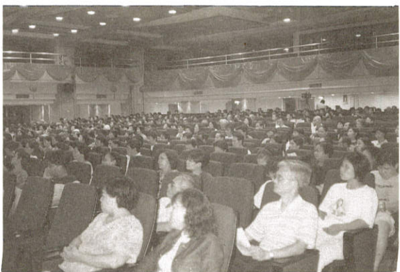
· 信眾聆聽佛法盛況一景