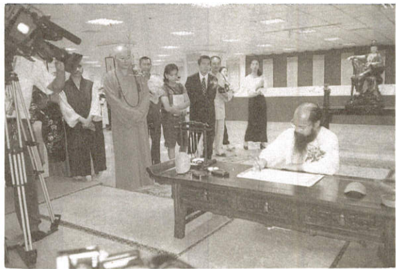
· 經展指導老師寂光山人現場揮毫實況