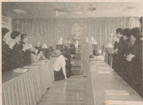
供養法師、禮謝法師。感恩盡在不言中