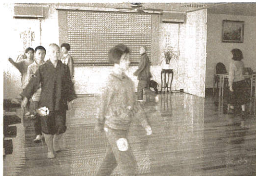
行香時學員仍保持正念動靜一如