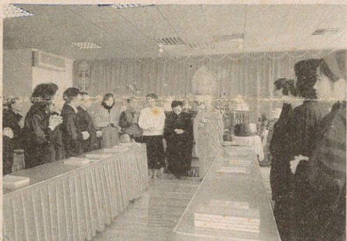
張緞師姐是佛化家庭的最好典範