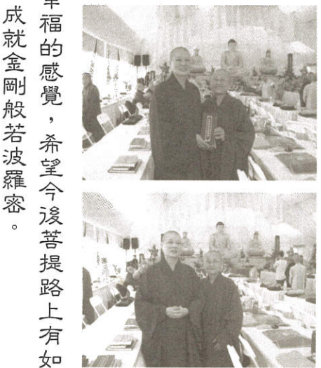
民國七十年十月結緣於樹林海明寺戒場——左二左三（後排）

進入福嚴佛學院，是民國七十年的事了。是修福後生起的修慧因緣嗎！一向不太愛讀書的我，在道場裡點點滴滴的薰習後，以及對經典的疑問，竟與起前注福嚴佛學院讀書的念頭。有發心也會升起障礙的高牆的常住還在興建中缺乏人手是其一；又師公上人經常耳提面命：「到佛學院十去九不回的！」是其二，考慮再三後，終於開口懇求，師公不假思索即點頭答應，真讓我喜出望外！這也讓我更確定「做就是了！做才能成就！」