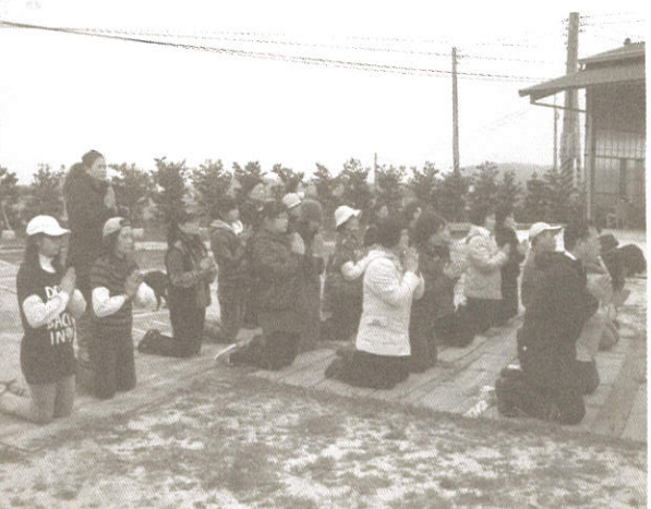
大年初一朝山禮佛·全年好萬事佳