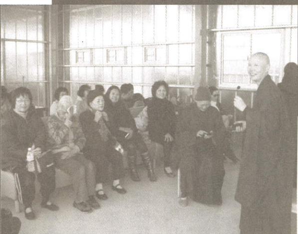
開山寮第一次使用·大家歡樂融融