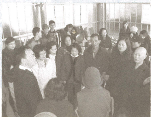
寧靜片刻與佛交心·天地人我一家親