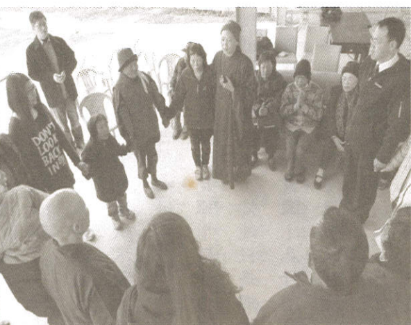
同願同行傳送幸福