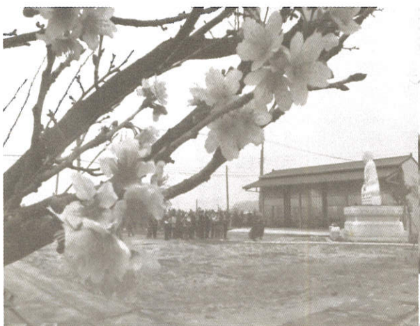
春暖花開春意濃·禮佛禮心正當時