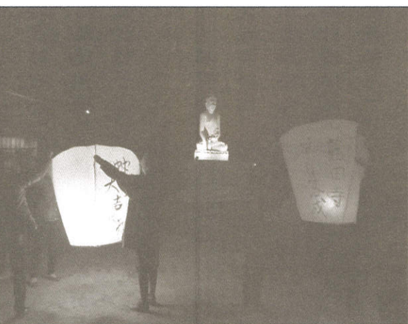
扶持天燈等待滿足