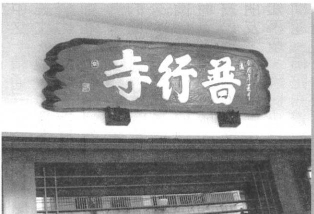
▲換上新風采-普行寺