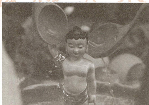
慈能與樂悲能拔苦遠自於佛陀的愛