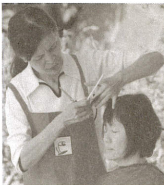
明圓師姐奉獻義剪

諸位讀者大德： 為了珍惜資源，及實際需要，如果勤修月刊給您帶來不便，敬請撕下雜誌上面的標籤，寄給我們，以便作業。謝謝您的關懷與鼓勵。