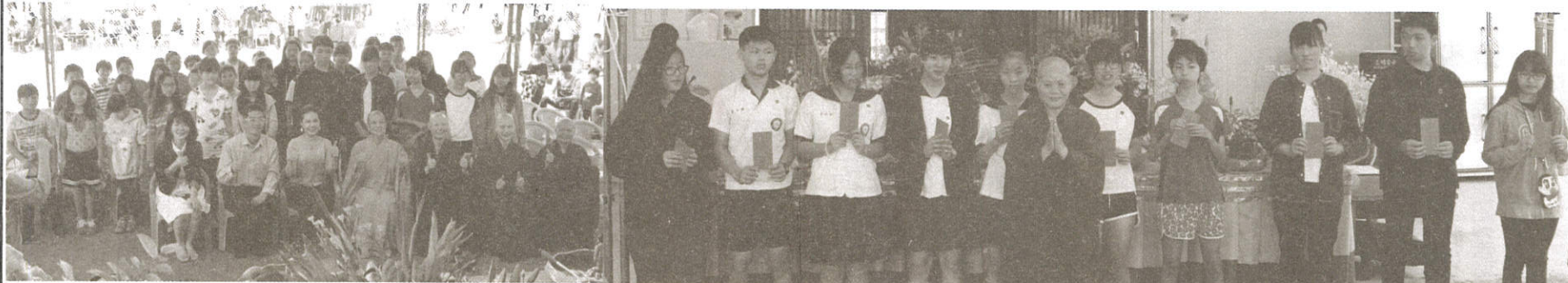
藍田寺第一屆慈愛獎助學金全體留影