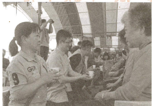
深情奉茶報答母恩