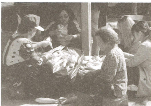
默默耕耘勿香積菩薩準備美味佳餚