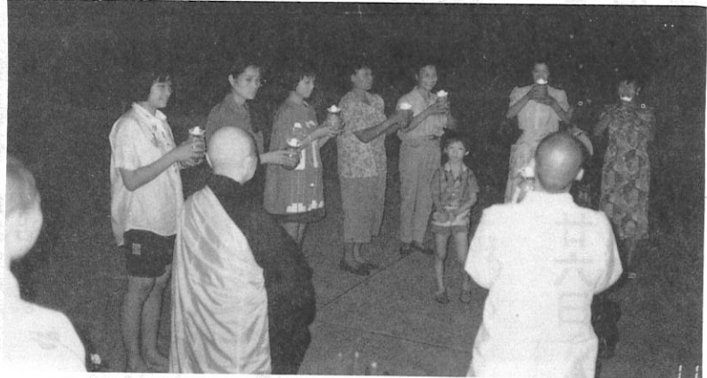
中秋佳節師父帶領大眾傳智慧之燈

說的再明白些，佛學家們就是為了讓衆生了解心，所以把心分爲很多種，佛心、眞心的更緊了。眞心不在書本裏，不在心經裏，是在「老老實實」的行住坐臥裏，經典、論典，只是標月之指，若指標爲月，那不是大妄心，是什麼，如此深入經藏，不如老實念佛，「心」還顯得清澈些。