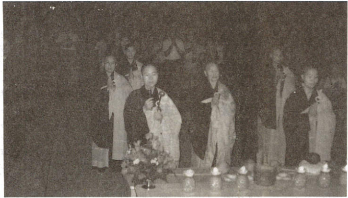
▲中秋佳節師父率衆信徒唸佛拜願伶聽法師開示