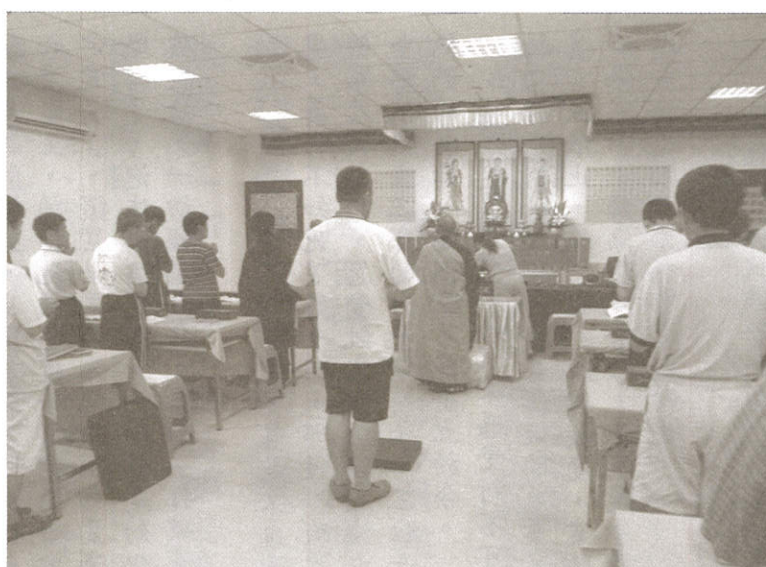
華嚴啓能中心懺摩法會