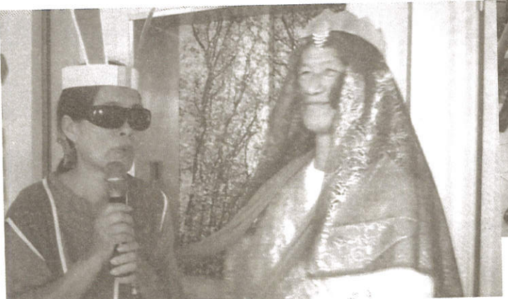
玉兔伴嫦娥，是玉帝的賞賜