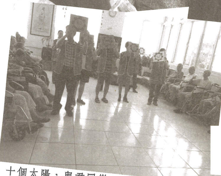
十個太陽，與君同樂