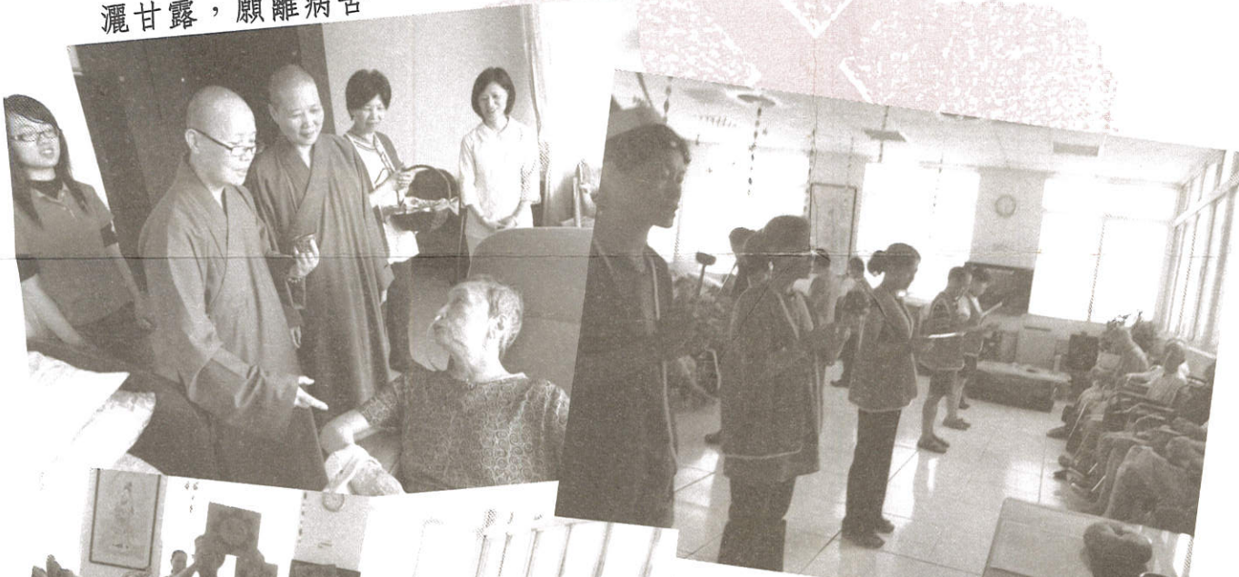
溫情暖心房，老人不孤單