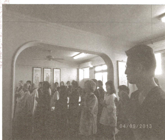
一年一度僧寶節道糧法會 大眾虔誠 供佛 普施 供養