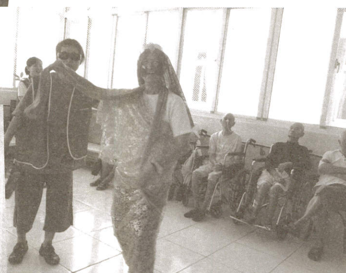
陳會長反串嫦娥，大愛而無礙