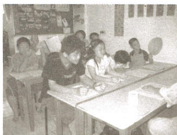
▲ 室內、室外聽經 大異其趣...