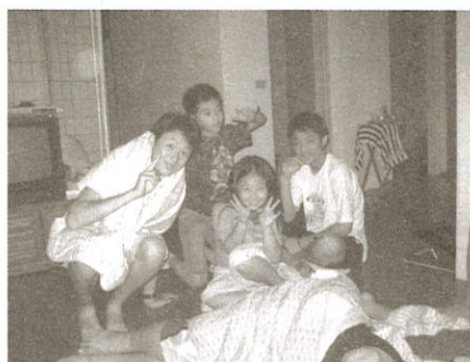
▲ 夜深了，可是捨不得睡~