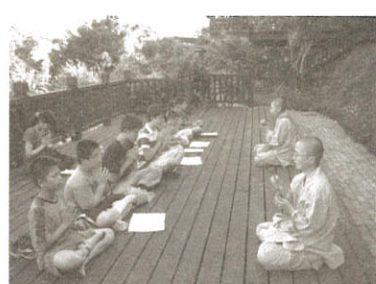
▲ 天地之間作晚課!除了法器聲又多了鳥叫蟲鳴來配樂嘍!