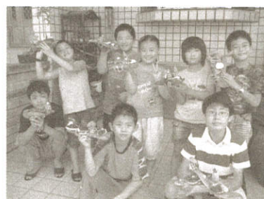
▲ 我的DIY作品 帥!