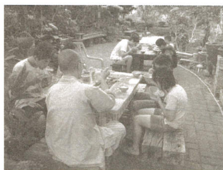
▲ 庭園清涼早餐，一天活力的泉源...