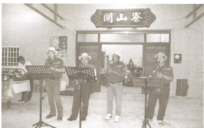
與佛有約賞月茶會鐵支樂團熱情演奏

諸位讀者大德： 為了珍惜資源，及實際需要， 如果勤修月刊給您帶來不便，敬請 撕下雜誌上面的標籤，寄給我們， 以便作業。謝謝您的關懷與鼓勵。