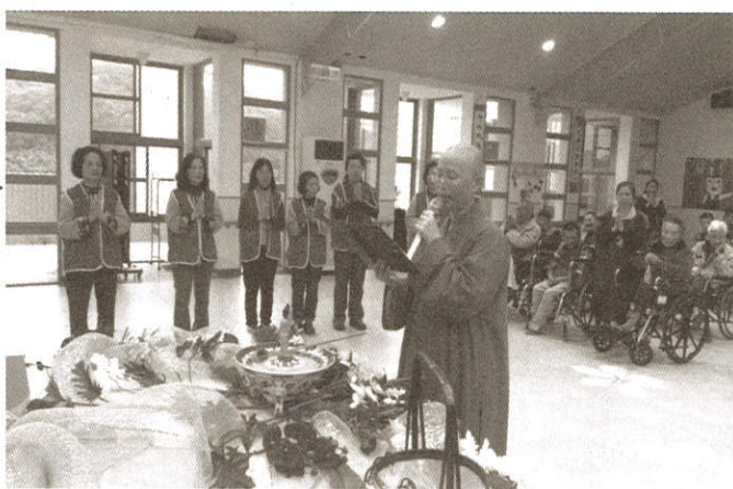
祈願 五濁眾生離塵垢