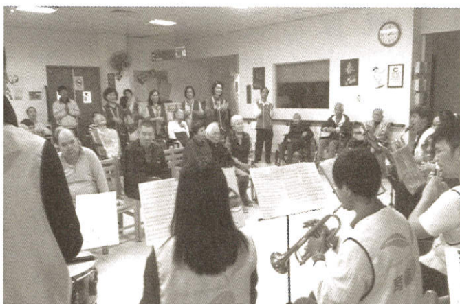
文一志工與聯合大學樂團學生共同關懷長者

諸位讀者大德： 為了珍惜資源，及實際需要， 如果勤修月刊給您帶來不便，敬請 撕下雜誌上面的標籤，寄給我們， 以便作業。謝謝您的關懷與鼓勵。