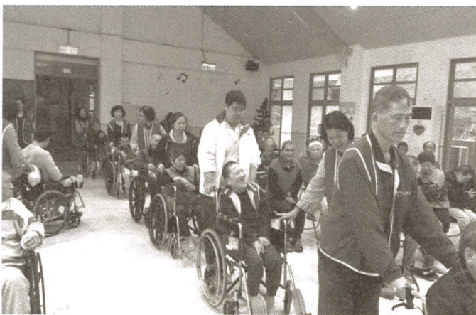
向前推，跨越肢體障礙也能找到幸福