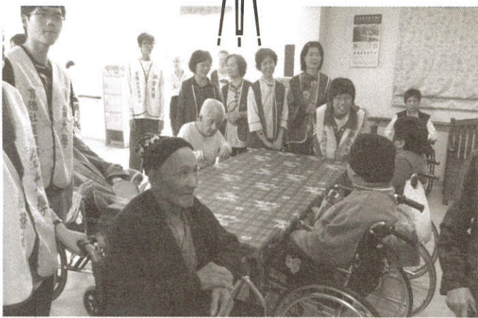
猜一猜阿公、阿嬤說什麼？