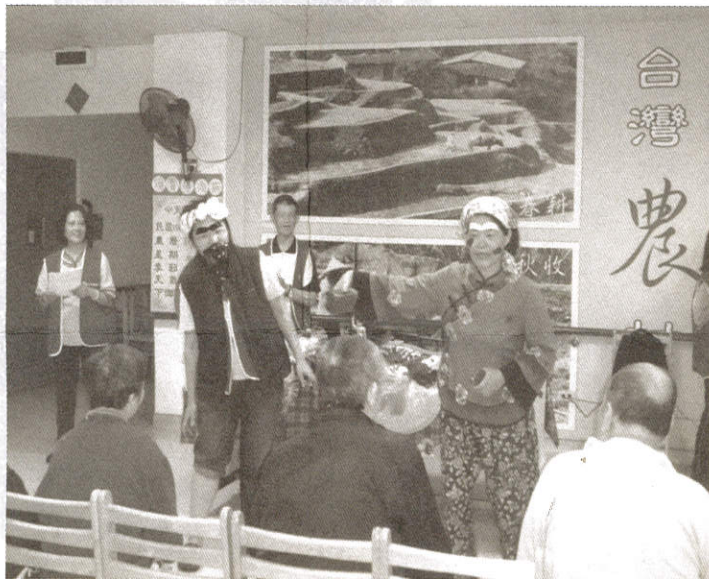
張緞與詔紅逗趣長者的扮相