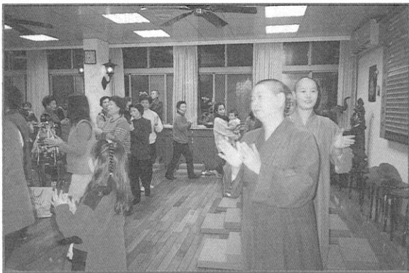
《歲末聯歡—大家一起動一動》

脂肪過多導致肥胖，是威脅生命的危險因子，如心臟病、高血壓、糖尿病、膽囊疾病等均與肥胖有密切關係。