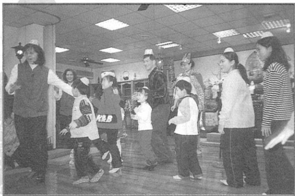
《不分老少，不分族群，多多動一動》